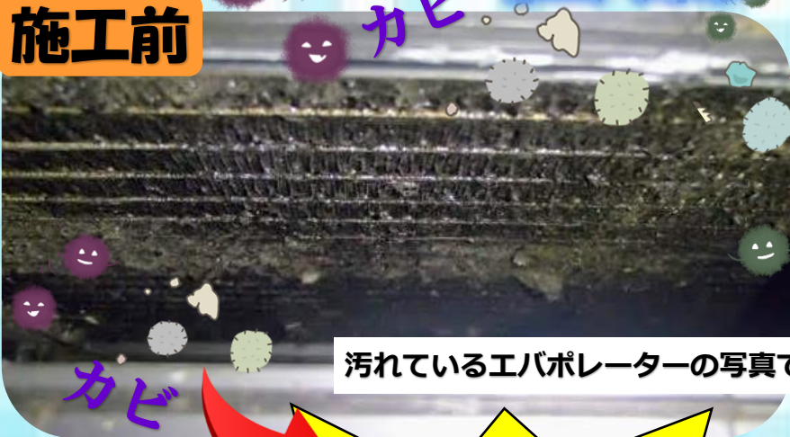
汚れているエバポレーターの写真です。