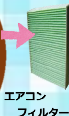
エアコン フィルター